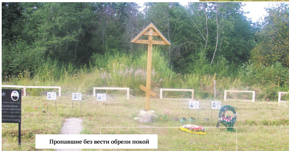
Пропавшие без вести обрели покой