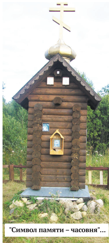
"Символ памяти – часовня"...